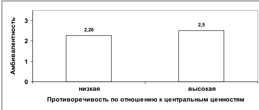
Рис. 2. Субъективная амбивалентность в зависимости от противоречивости по отношению к центральным ценностям

В соответствии с ожиданиями были обнаружены различия в степени субъективной амбивалентности в том случае, когда предмет суждения имел только позитивные связи с центральными ценностными представлениями испытуемых, в отличие от тех случаев, когда создавалась противоречивая реализация ценностей в отношении центральных ценностей. По меньшей мере, еще в одном случае (непротиворечивое позитивное отношение к нецентральным ценностям) можно было ожидать отчетливое различие условий противоречивости. Прежде всего это противоречит обобщенной гипотезе о противоречивости, в которой содержательные области идентичности (материально-экономические или идеально-символические) не противопоставляются.