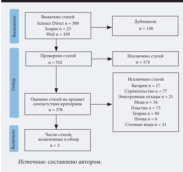
Рис. 1. Процесс системного обзора литературы