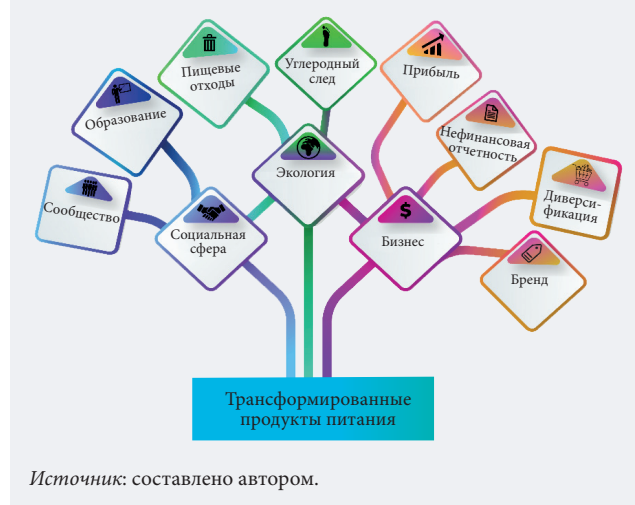
Рис. 4. Некоторые выгоды раннего принятия трансформированных продуктов питания

На рис. 3 обобщены более 11 000 аннотаций к исследованиям; соответствующие факторы разделены на два принципиально различных кластера.