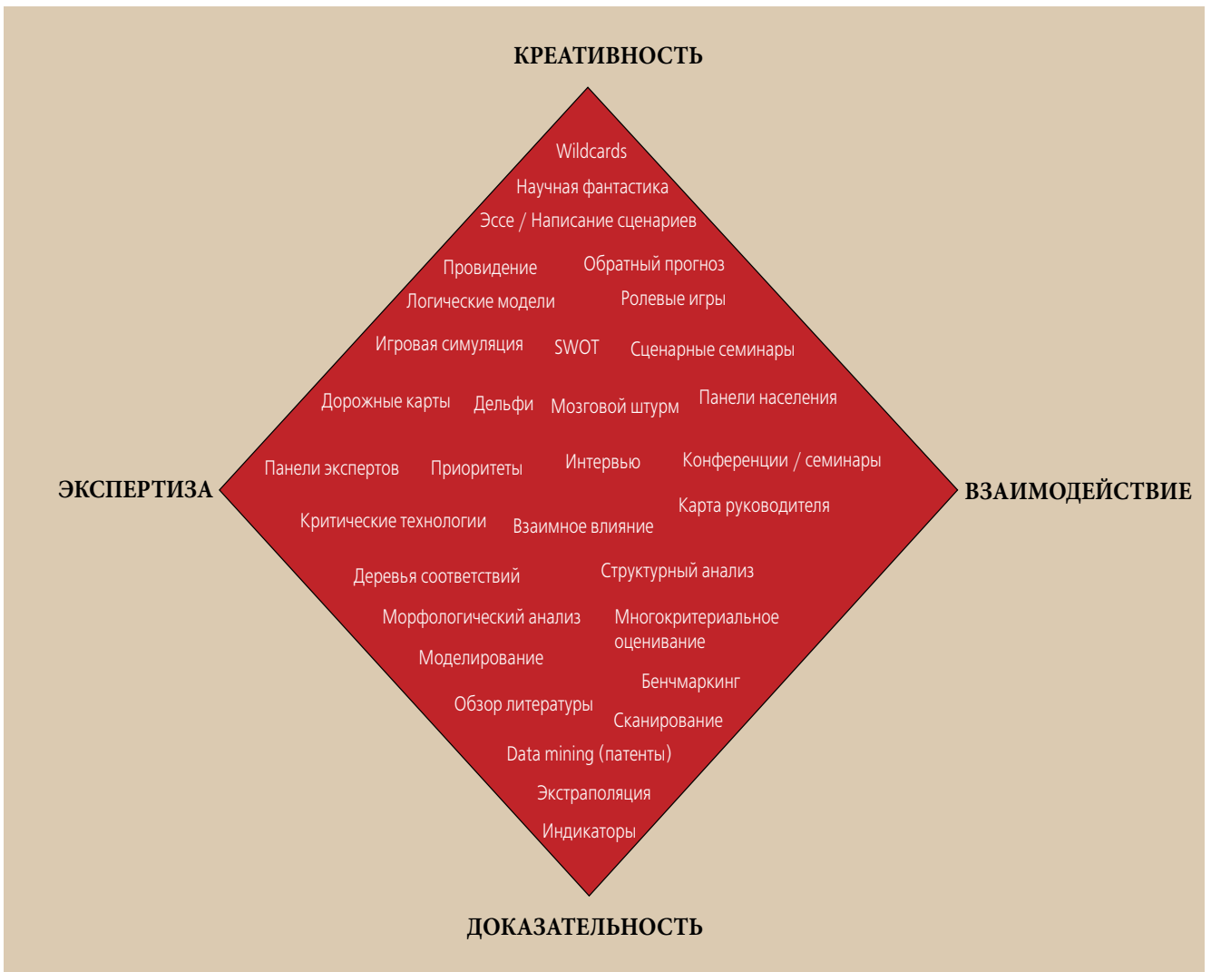
Рис. 2. «Форсайт-ромб»

виде они были представлены в виде двух групп приоритетов в «Комплексной программе научно-технического прогресса СССР». Первая группа включала исследования в области электроники, информатики и вычислительной техники, новых материалов, наук о жизни, научного приборостроения и др. Во вторую группу входили фундаментальные исследования. В начале 1990-х годов, уже в Российской Федерации, работа по выбору научно-технических приоритетов была продолжена, и ее статус поднят с ведомственного до общегосударственного уровня. В 1996 году Правительственная комиссия по научно-технической политике утвердила перечни 10 приоритетных направлений развития науки и техники и 70 критических технологий. В те годы, когда экономика страны находилась в состоянии кризиса, а наука финансировалась по остаточному принципу, научно-технические приоритеты носили достаточно формальный характер, а основной задачей научной политики было сохранение научного потенциала страны.