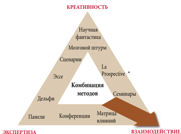
Рис.1. «Треугольник Форсайта»

Набор методов, применяемых в том или ином проекте, может выбираться с учетом множества факторов: временных и ресурсных ограничений, наличия достаточного количества высококвалифицированных экспертов, доступа к информационным источникам и др. Тем не менее ключевым условием успешности проекта является использование методов, обеспечивающих эффективную работу привлекаемых экспертов.