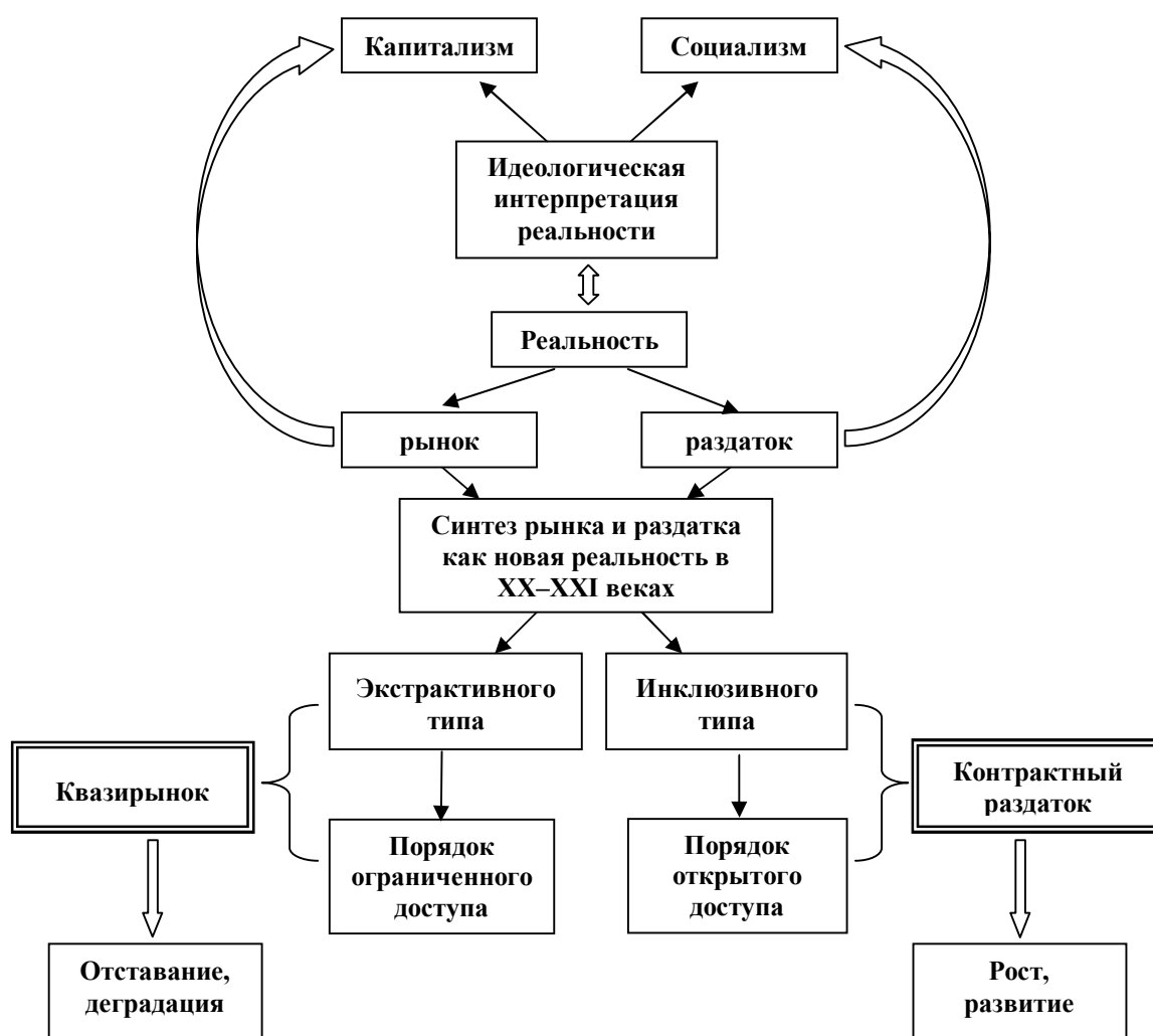
Рис. 2. Новая реальность как рамка развития в XXI веке