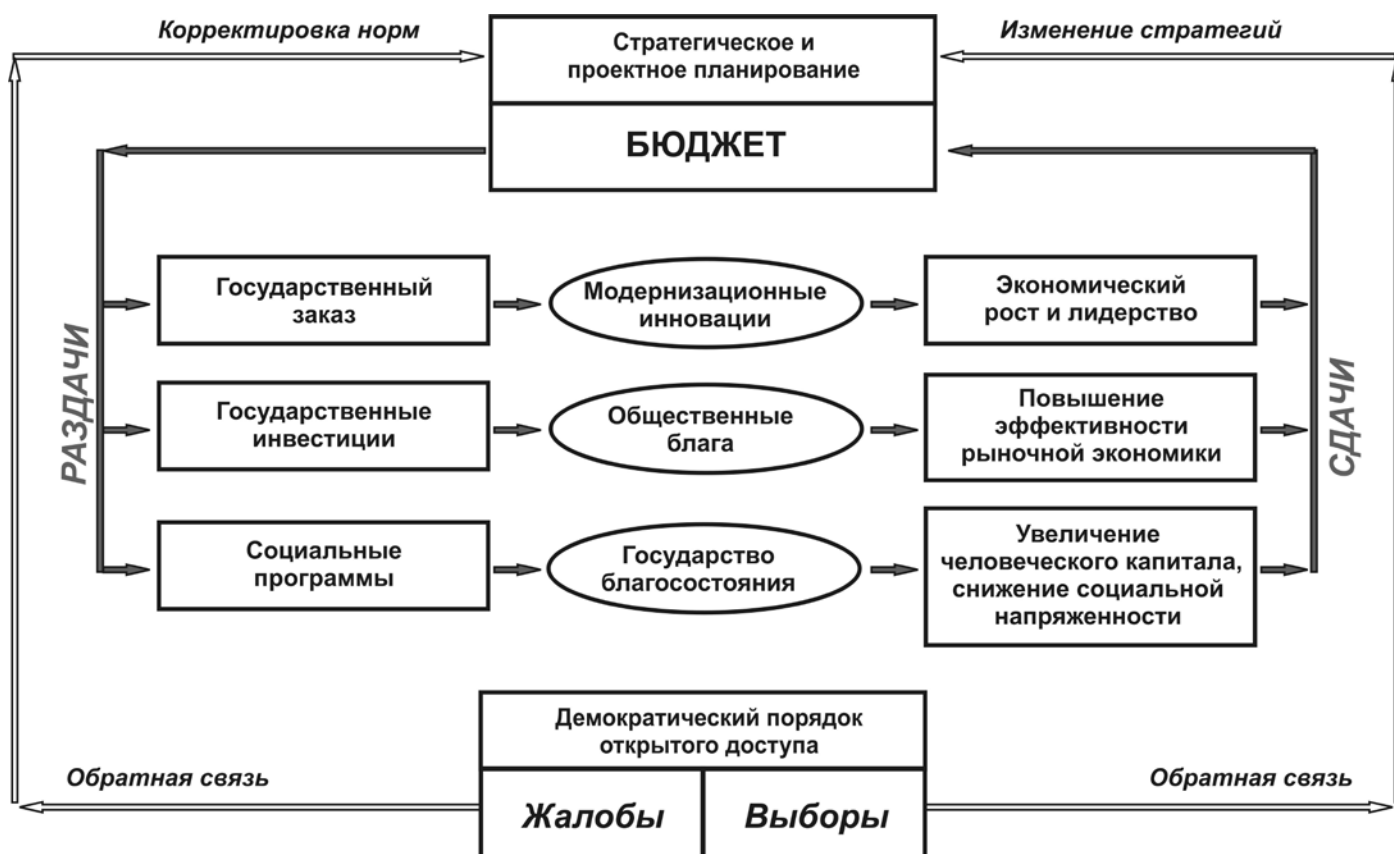
Рис. 3. Развитие социального государства на основе институциональной матрицы контрактного раздатка

Анализ исторического процесса свидетельствует, что современный демократический механизм со всеобщим избирательным правом появился именно в связи с синтезом рыночных и раздаточных институтов, поскольку это позволило отменить избирательные цензы. «Институт гражданства в западных странах зародился в XVIII веке, однако в то время ограничивался правами, обеспечивающими защиту граждан от произвола государственной власти. В следующем столетии, когда доступ к избирательному